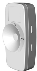
Retro con ventosa