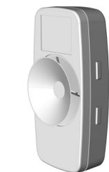
Face arrière avec ventouse